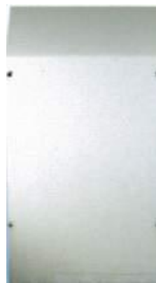
弱溶剤形フッ素樹脂塗料