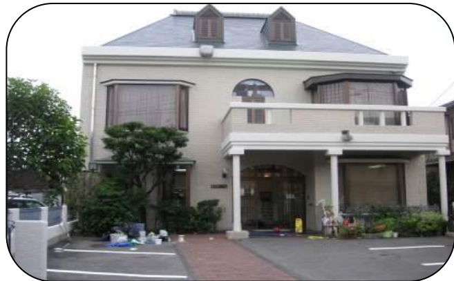
滋賀県 ○医院(カラーベスト)