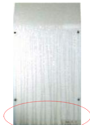
雨だれ汚染が著しい