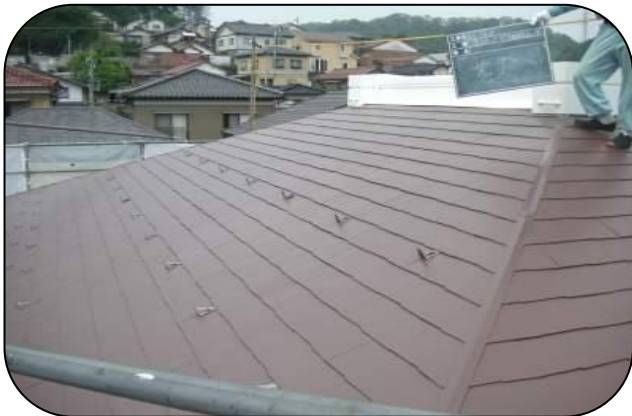
石川県 S邸(カラーベスト)