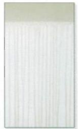
汎用シリコン塗料