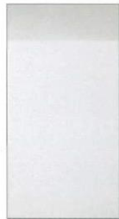
コスモファインマイルドルーフS