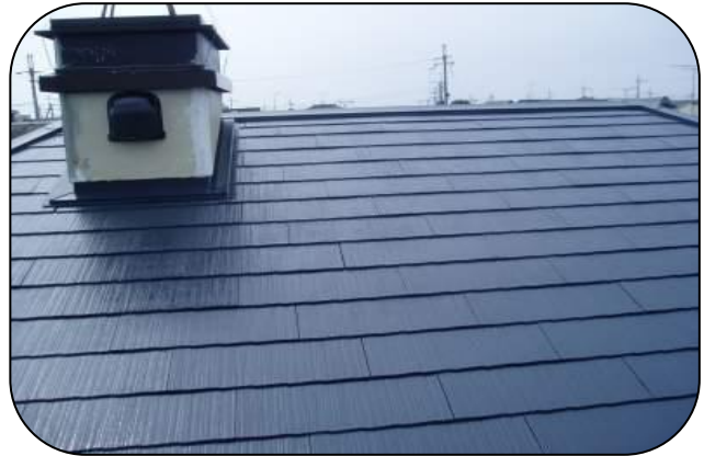
滋賀県 H邸(カラーベスト)