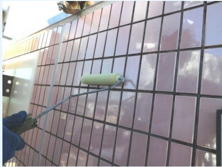
鏡面タイル面 GC-500施工

弾力性タイプの接着剤のため、応力の多く作用する部分や膨張率の異なる部材の貼り合せに適しています。