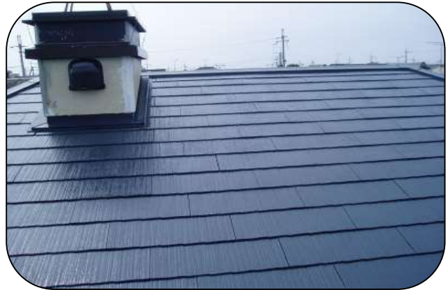
滋賀県 H邸(カラーベスト)