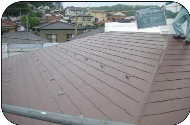
石川県 S邸(カラーベスト)