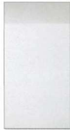
コスモファインマイルドルーフSダンセイ